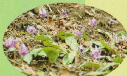
⑨ カタクリの群生 (4月下旬~5月上旬)