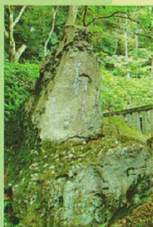
⑤ 松尾芭蕉の句碑 湯をむすぶ 誓いも同じ 岩 清水