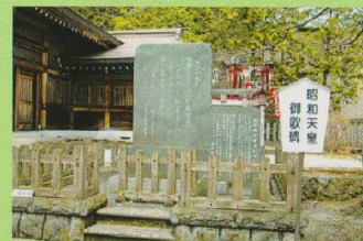
③ 昭和天皇御製・皇太后宮御歌の碑