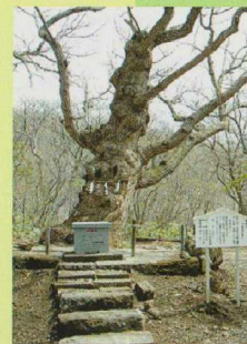
⑥ 御神木「生きる」 (推定樹齢800年)