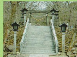
⑦ 三之鳥居 (那須余一奉獻)